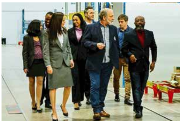
Visites d'entreprises dans les différents secteurs d'activités économiques