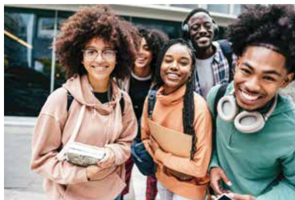
Soft-Skills durant tout le Cursus de Formation