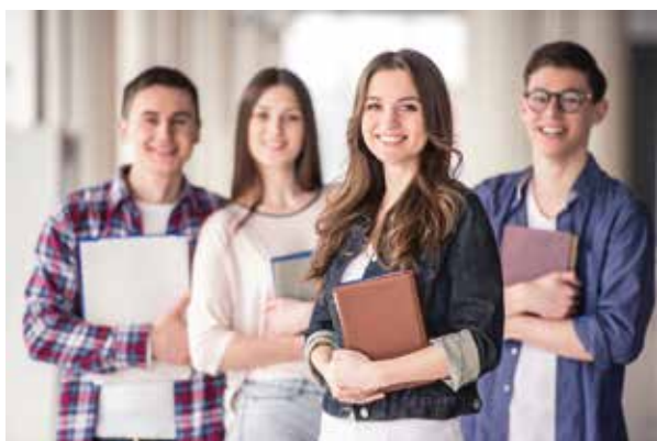
Tronc commun pour acquisition des Fondamentaux en Management des Entreprises