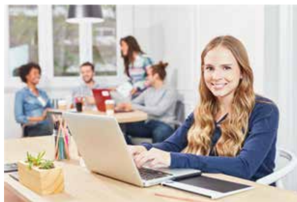
Stages en Entreprise durant le cursus de Formation